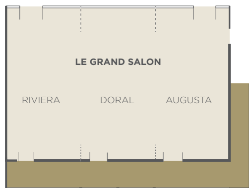
LE GRAND SALON