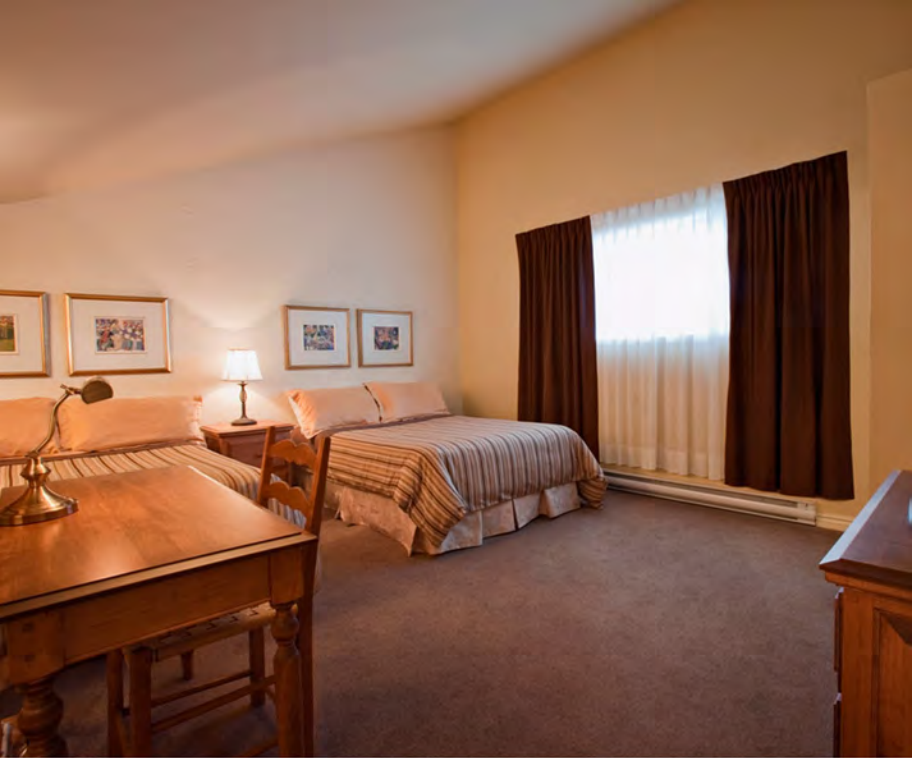
Chambre 2 lits doubles sur 2 étages - Côté Jardin