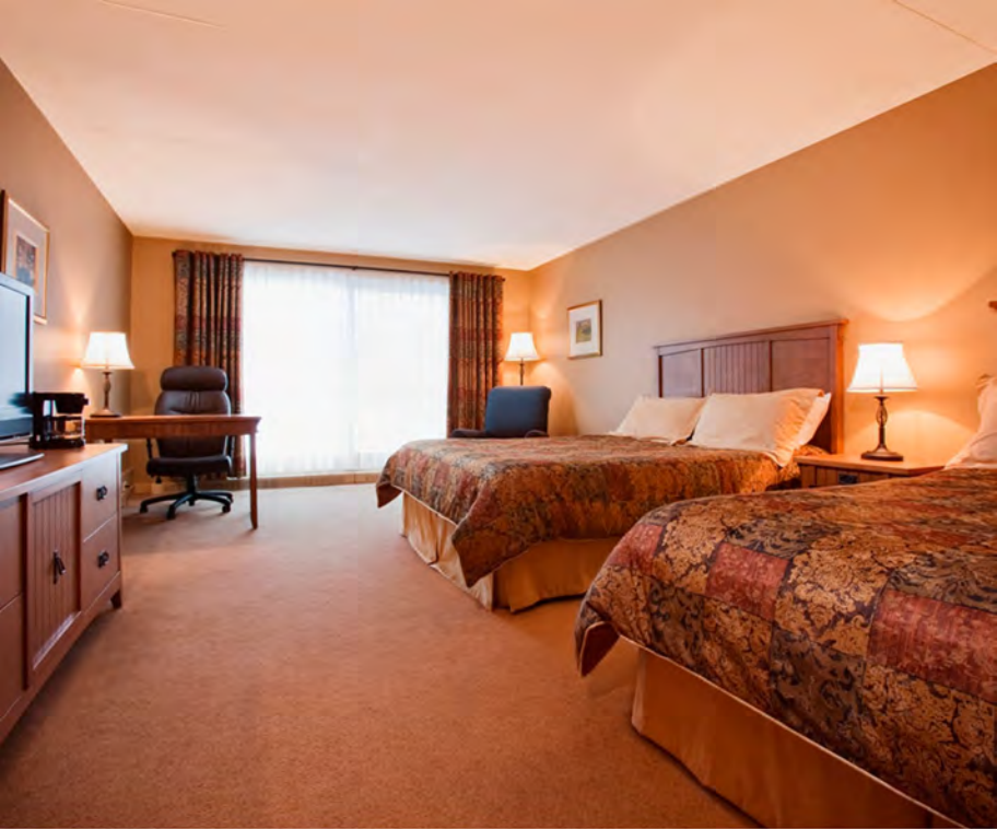
Chambre 2 lits Queen - Côté Pavillon