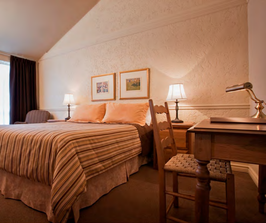
Chambre 1 lit Queen - Côté Jardin