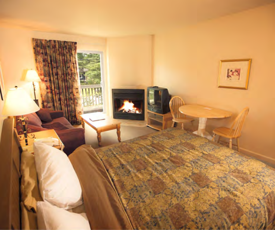
Suite 1 lit Queen, 1 divan lit et foyer - Côté Jardin